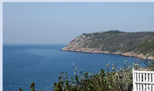
Den nordvästskånska kusten ska skyddas från föroreningar.