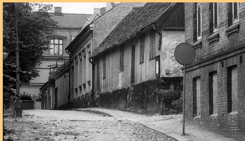
Vattengatan, som den såg ut 1962, året efter revs dessa byggnader.

Det andra temat, som också blir mycket bildrikt, ska handla om 1970-talet. Det var de åren