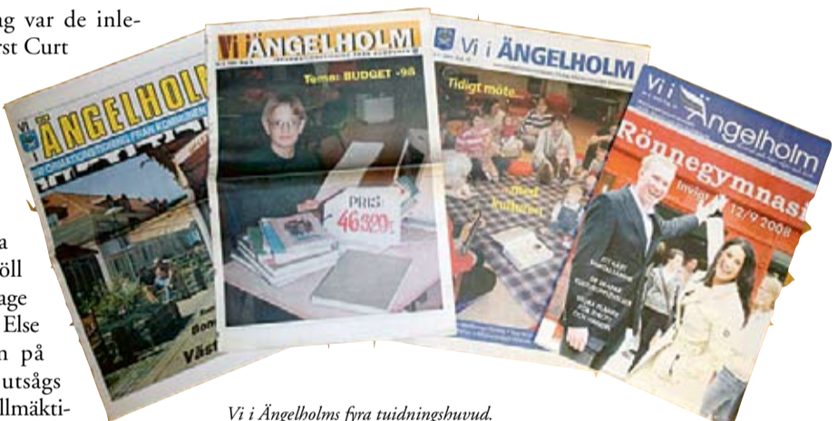
Vi i Ängelholms fyra tidningshuvud.