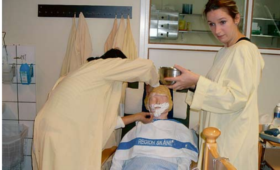
Eleverna övar praktiska moment i skolans metodrum inför sin praktik.

Elever kombinerar svenskundervisningen för invandrare med en kurs i vård- och omsorg där också praktik ingår är ett lyckat integrationsprojekt på vuxenutbildningen i Ängelholm. Det kommer att bli stort behov av arbetskraft inom vården och det är då viktigt att få med personal med annan kulturell bakgrund och dubbel språklig kompetens.